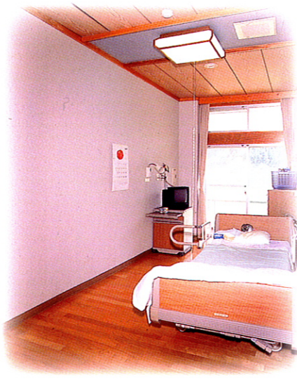
◆療養室 広々とした室内 窓に広がる田園風景

個人リハビリ・小集団リハビリ・認知症リハビリ・創作活動・音楽療法などをその人に合わせ毎日提供しています。