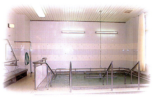
▲一般浴室 ヘルストーン温泉で温質良好