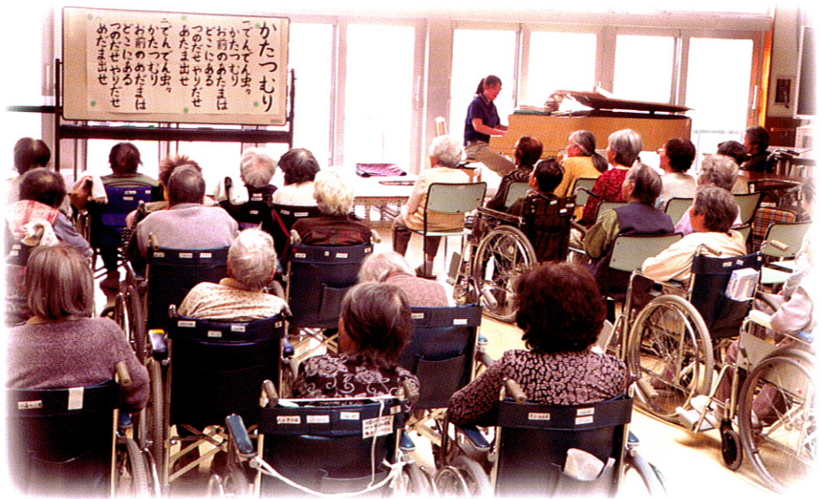
▲音楽療法のひとコマ